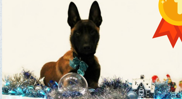
Charlotte et ice dream