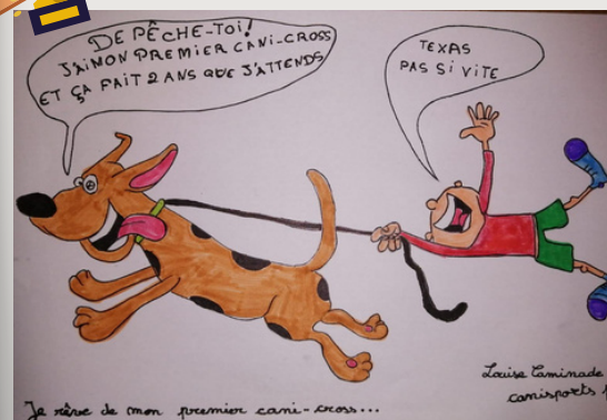
Gagnant du concours de dessins humoristiques - Club FFSLC : Canisport 19 (Corrèze)

Un grand merci à tous ceux qui ont participé à notre concours de dessins humoristiques ! Vos créations ont été un régal pour nous ! Vous retrouverez dans la newsletter de mai, l'intégralité des dessins qui nous ont été envoyés. Restez à l'affut !