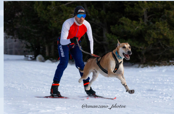
© Stage Ski-Joëring décembre 2023 / Eva MANZANO