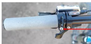
Vis de réglage de l'inclinaison du levier de frein sur le cintre.

Pour cela vous pouvez desserrer la fixation du frein sur le cintre du VTT et changer l'inclinaison de levier de frein.