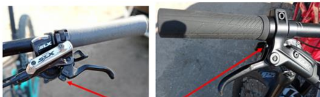
Molette ou vis de réglage de la garde du frein, se présentant de façon différente en fonction des modèles qui en sont pourvus.

De plus, ce réglage n'est pas toujours disponible, cela dépend des VTT.