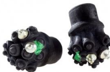
Embouts « terminator »

13.2.2e Concernant les bâtons : les pointes nues et les embouts dits « terminator » sont strictement interdits en Canimarche Nordique (cf. tableau des pénalités art. 20.65).